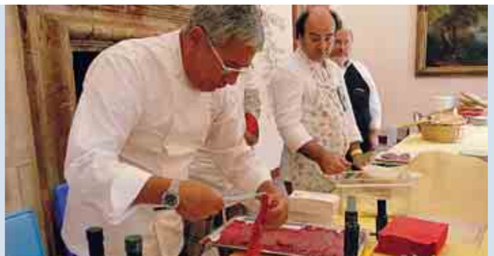
Presentazione ufficiale per il manzo kobe made in Brianza al castello di Sulbiate, giovedì mattina: ecco i cuochi al lavoro con la carne degli animali allevati nell'azienda