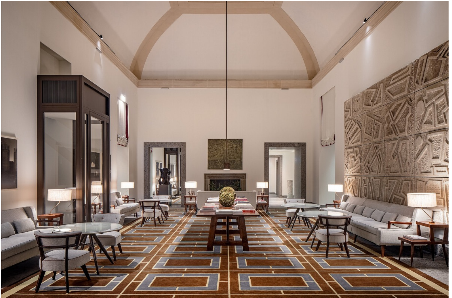
La lobby del Portrait Milano

U n hotel attorno al quale si muove un mondo di arte, gusto e mestieri. È Portrait Milano , il nuovo cinque stelle che porta nel capoluogo meneghino lo stile e l'accoglienza di Ferragamo . L'hotel entra così a far parte della Lungarno Collection , aggiungendosi a quelli già esistenti a Firenze e Roma. Inaugurato oggi, 14 dicembre, il Portrait ridà vita, dopo oltre vent'anni, a uno dei luoghi segreti più affascinanti del Quadrilatero, l'ex Seminario Arcivescovile di corso Venezia . La struttura è stata completamente rinnovata grazie a un progetto conservativo promosso proprio da Lungarno Collection e affidato all'architetto Michele De Lucchi e al suo studio Amdl Circle.