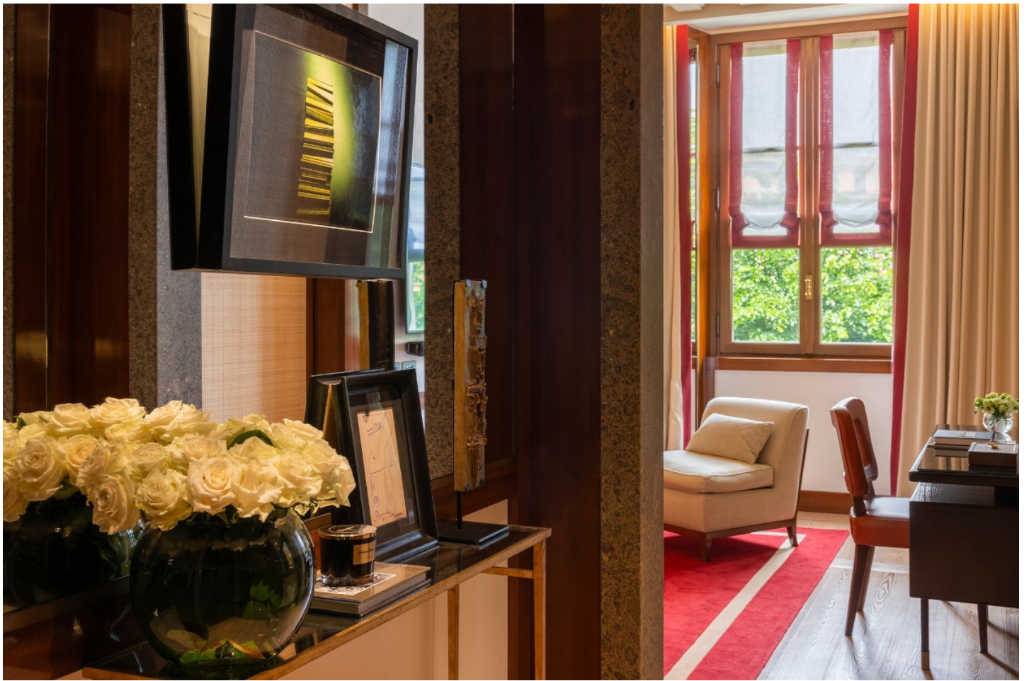
Una delle stanze di Portrait Milano